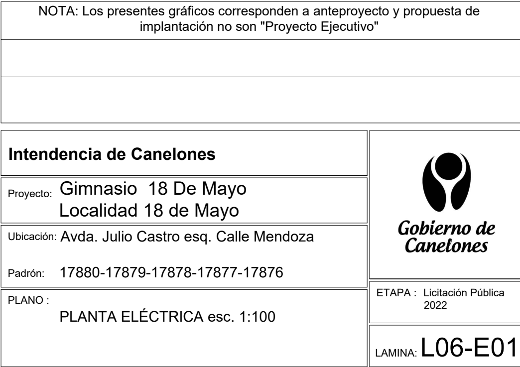
PLANTA GIMNASIO ESC_1.100